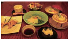
*写真は、イメージです